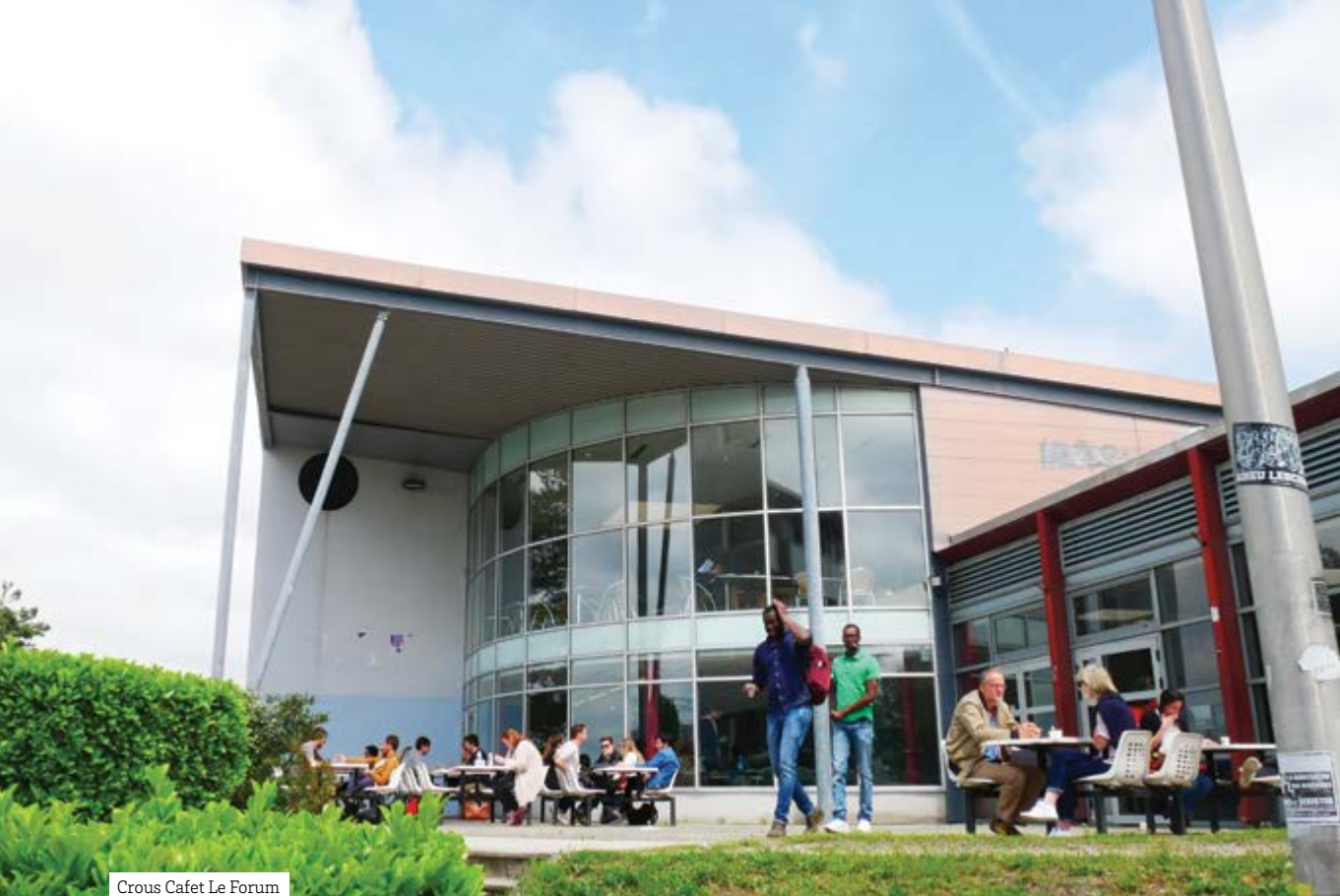
Crous Cafet Le Forum