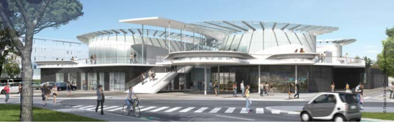
© Franck Ruy & Denis Dubois, Architectes

À proximité de feu le village 5, derrière l'Université Bordeaux Montaigne, l'espace multi-services (nom de code EMS) devrait être progressivement ouvert au public étudiant à partir du premier semestre 2020. Pas de retard à prévoir, les travaux ont commencé en 2017.