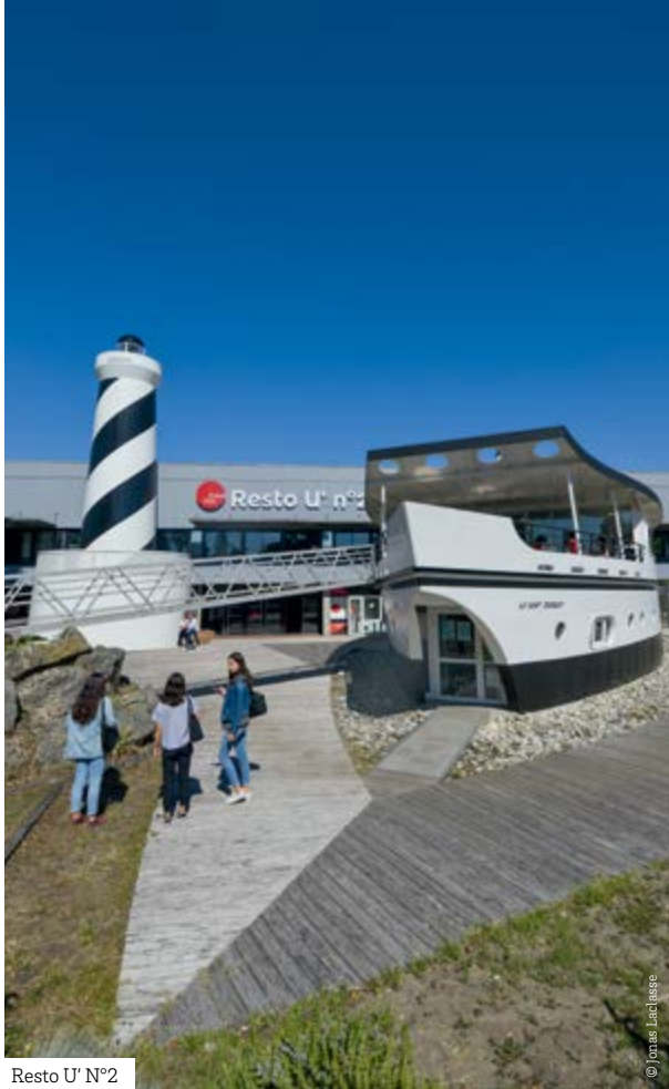
Resto U' N°2