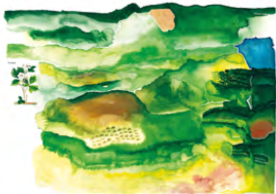
Étude de paysages de la montagne limousine, 2025. Aquarelle et gouache sur papier, 65 x 50 cm. Commande de Quartier Rouge dans le cadre de l'édition à paraître Des assemblées pastorales - Cohabiter avec les loups sur la montagne limousine