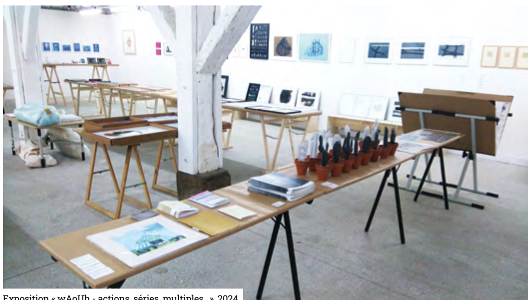
Exposition « wAoUh - actions, séries, multiples... », 2024

et aux performeurs – des artistes particulièrement précarisés – chez Lac& Lavitrine. Ou encore, mutualisation des outils, des locaux, des savoir-faire, avec un esprit de fab lab du côté de .748. Tous font preuve de résilience et d'engagement face à l'absence de certains acteurs sur le territoire et au durcissement du contexte économique. Ces artistes ne se substituent pas aux galeries ou aux institutions, mais inventent d'autres circuits et d'autres fonctionnements, adaptés à leurs réalités.