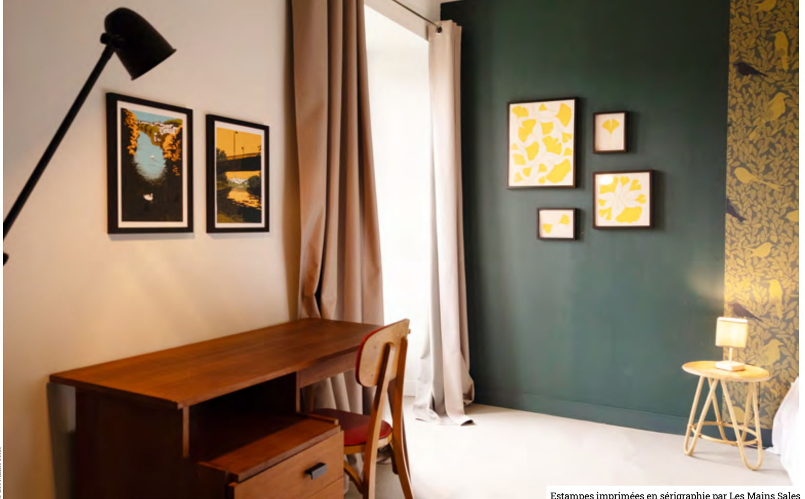
Estampes imprimées en sérigraphie par Les Mains Sales

Autrefois simple outil de reproduction, l'art imprimé est devenu un espace de créations originales particulièrement accessibles. Photographies, sérigraphies, lithographies ou gravures circulent hors des galeries classiques, portées par des ateliers collaborant avec de nombreux artistes. Quelles motivations animent ces structures, souvent associatives ? Quel est l'impact de cette politique de prix modérés sur leur modèle économique ? Et comment se crée le lien avec les acquéreurs ? Échanges sur ces enjeux avec trois acteurs régionaux : l'atelier de photographes Cdanslaboite (Bordeaux) et les ateliers d'estampe Le Bouc et Les Mains Sales (Charente). Par Hélène Dantic